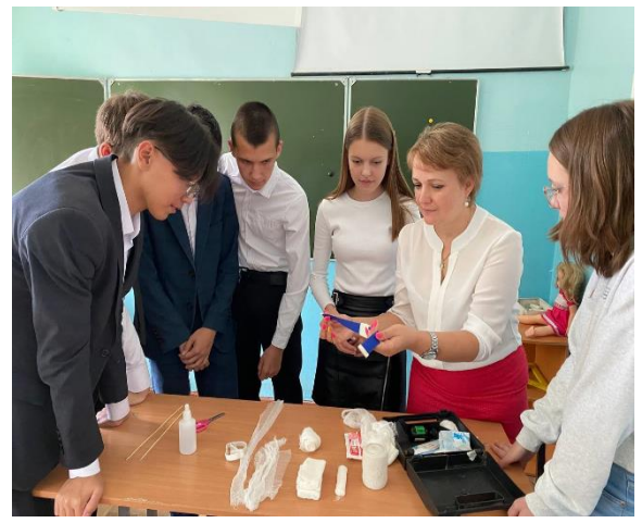
Уроки по безопасности в рамках изучения предмета ОБЖ

Ссылки где были освещены вся работа школы по исполнению плана месячника ГО.