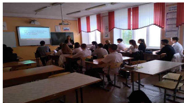
Классные часы по различным темам в рамках месячника ГО