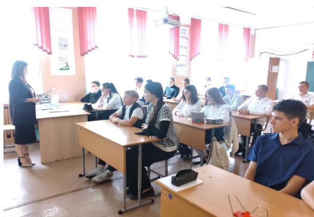
«Пятиминутки по безопасности»