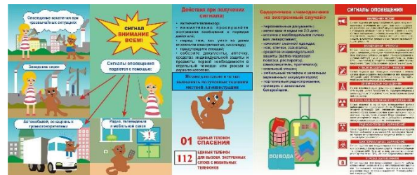
Информирование родителей в родительских группах через мессенджеры по правилам предупреждения и поведения при ЧС