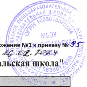
График проведения ВПР на 2023-2024 учебный год по МБОУ "Южноуральская школа"